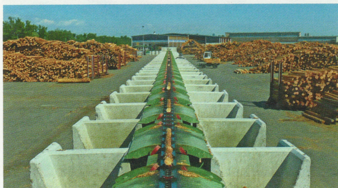
Vom Sortieren bis zum Horizont ...