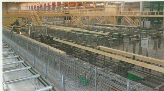
... bis zur kompletten Leimholzfertigung geht das CTR Holztechnik-Angebot